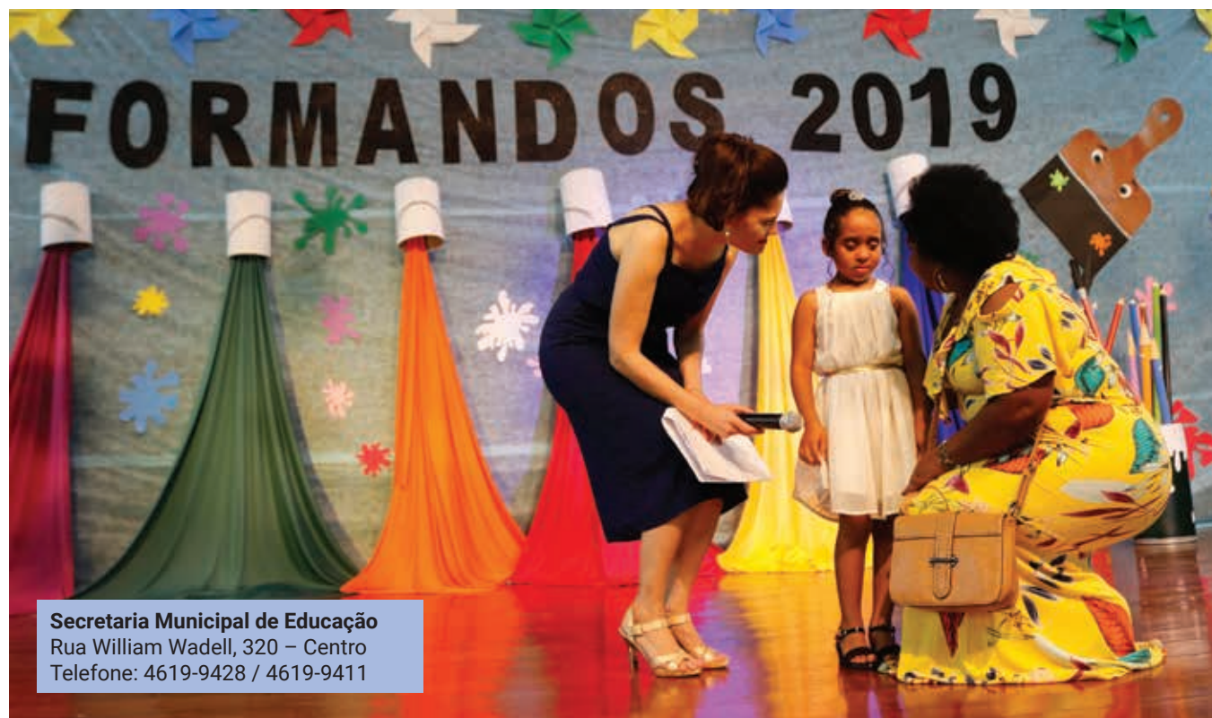
Secretaria Municipal de Educação Rua William Wadell, 320 – Centro Telefone: 4619-9428 / 4619-9411

Outras ações também são promovidas pela Secretaria de Educação tais como: Educação ambiental, Simpósio de Educação Inclusiva, desfile cívico de 7 de se-